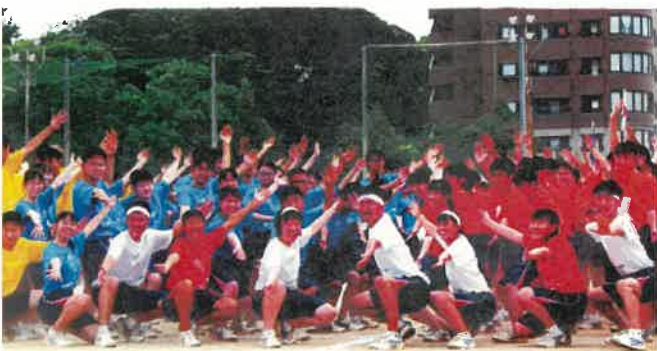
生徒たち主導の体育大会

また、天籟寺小学校の児童や地域の方々との清掃ボランティア活動を行う等の学校行事やフードロス削減の取り組み、ボランティア活動を通して人間力の育成を図っています。