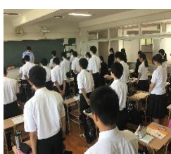
飲酒運転「ゼロ」を誓う黙とう

1点は、飲酒運転の撲滅についてです。8月25日(月)は、福岡市海の中道大橋において、幼い3人の尊い命を奪った飲酒運転事故から19年目でした。飲酒運転事故の悲惨さを再認識し、飲酒運転ゼロを目指す決意を新たにすため開催されていた「令和7年度飲酒運転撲滅県民大会」に合わせて、本校でも同日正午に飲酒運転「ゼロ」を誓う黙とうを実施しました。高校生の皆さんにとっても、決して他人事ではなく、突然、自分自身や大切な人が被害にあうかもしれません。家族など周りの人に飲酒運転をしないように声をかけることや、将来ハンドルを握ることになった時に飲んだら乗らないことを徹底するなど、心に決めて行動しましょう。